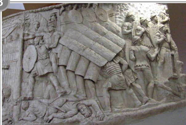
Légionnaires en formation de « tortue » Détail de la colonne Trajane (Rome).