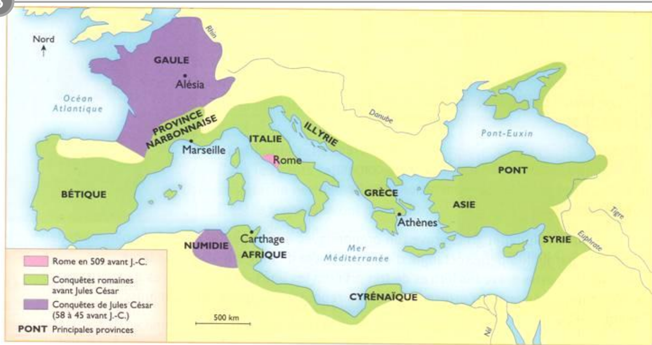
Les conquêtes romaines au temps de Jules César